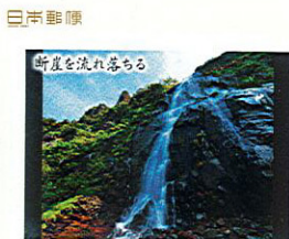
断崖を流れ落ちる