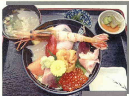
③食事処「日本海」一番人気!「まかない井」(イメージ) ※「まかない井」=魚介類の刺身などの具を飾りのせて並べたもの ※仕入によりネタの変更があります。