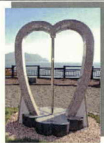
ラパスオーシャン

←明治32年に建設された旧ニシン番屋を復元。「未来に残したい漁業漁村の歴史文化百選」にも選ばれています。 新しい名勝「ラパスオーシャン」から日本海を一望できます。 ハートのモニュメント前で記念写真! →