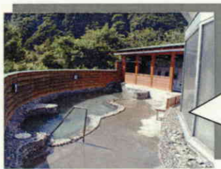
④浜益温泉(露天風呂)