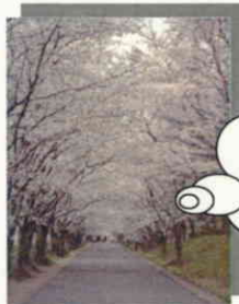
⑤戸田記念墓地公園(桜並木)

8,000本のソメイヨシノや八重桜が咲く風景は見事! 道内随一の桜の名所を散策できます!