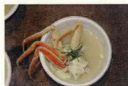
「チャリティ浜鍋」(イメージ)