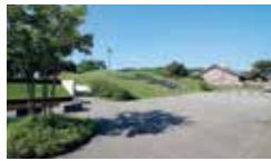
バザール広場・野外集会スペース

石狩の歴史を築き上げた先人の苦勞をたたえた碑で、石狩川を中央に配し、石狩を象徴する鮭とハマナスをモチーフにしたデザインになっています。